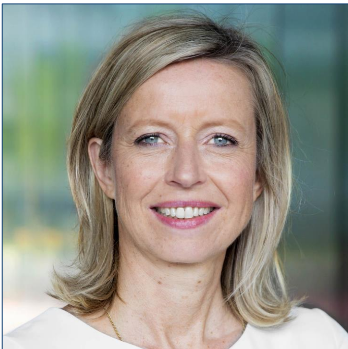
Kajsa Ollongren Minister van Binnenlandse Zaken